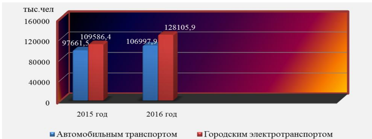
Рис.1. Объемы перевезенных пассажиров автомобильным и электротранспортом, тыс. чел.