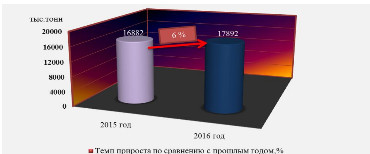
Рис.3. Объемы отправленных грузов железнодорожным транспортом, тыс. т.