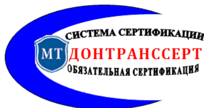
Рисунок 1. Знак соответствия обязательной сертификации объектов транспорта и дорожного хозяйства в Системе сертификации ДОНТРАНССЕРТ

10. Держатель сертификата, получивший разрешение, обязан прекратить использование знака соответствия в случае истечения срока действия сертификата соответствия, приостановления его действия или отмены.