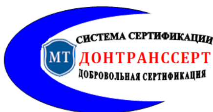
Рисунок 2. Знак соответствия добровольной сертификации объектов транспорта и дорожного хозяйства в Системе сертификации ДОНТРАНССЕРТ