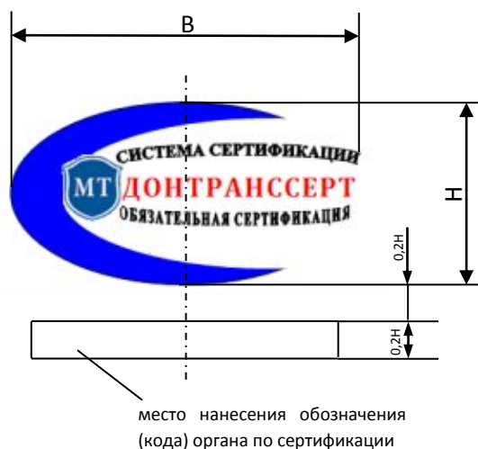
Рисунок 1. Знак соответствия обязательной сертификации объектов транспорта и дорожного хозяйства в Системе сертификации ДОНТРАНССЕРТ